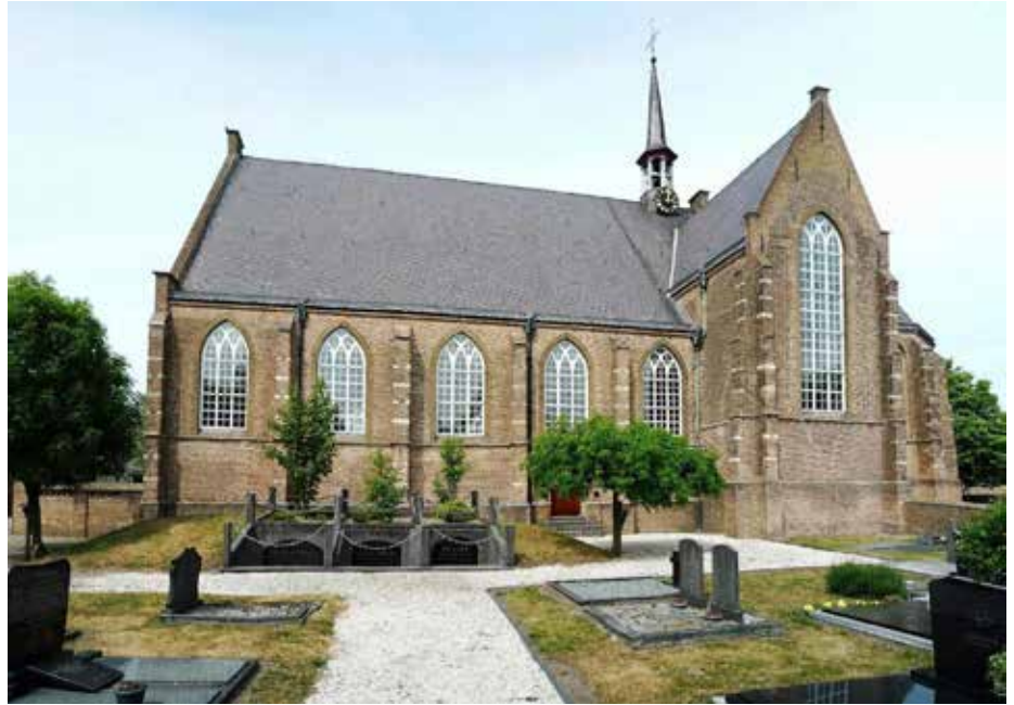
De Hervormde Kerk van Waspik.