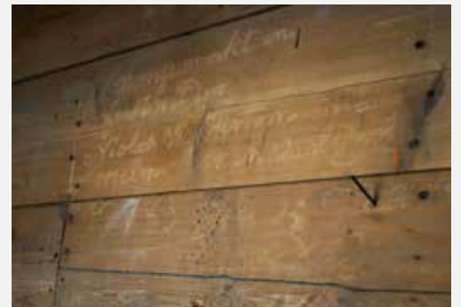
'Schoongemaakt en herstelt door Nicolaas van Hirtum, orgelmaker in Waalwijk, 1783'.