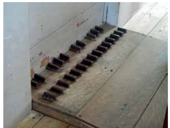
Kistpedaal voor restauratie