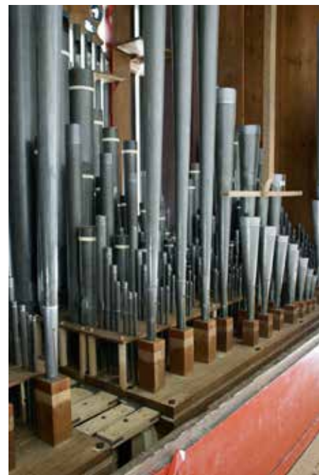
Hoofdwerkklade met verlengd pijpwerk van de Sesquialter.

De Hervormde gemeente te Waspik heeft met de restauratie van zijn