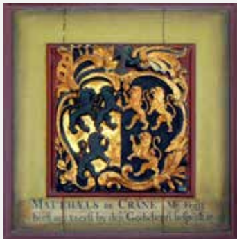
Tableau Matthæus de Crane.