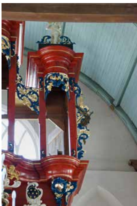
Detail gerestaureerde orgelkas.