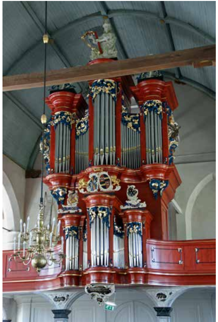
Na de restauratie van 2014/2015.