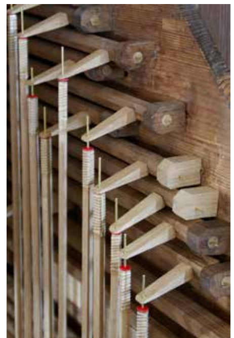
Detail gerestoreerde toetsmechaniek.

In de windladen werden veranderingen aangetroffen welke een directe invloed hadden op klank en stem-