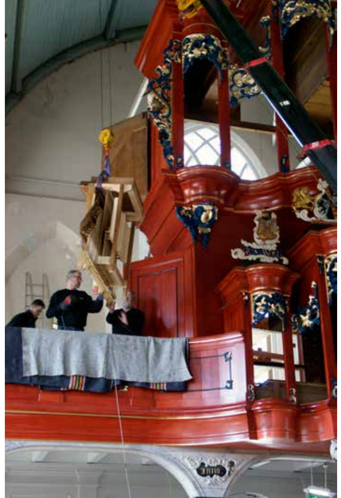
Het optakelen van de klavieren.