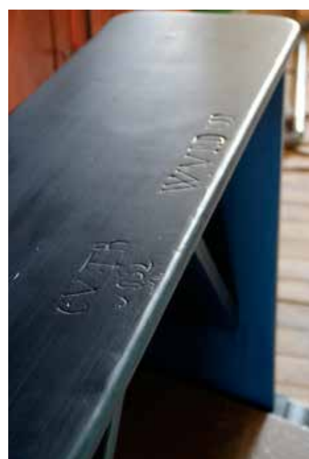
De gerestaureerde orgelbank met inscripties.