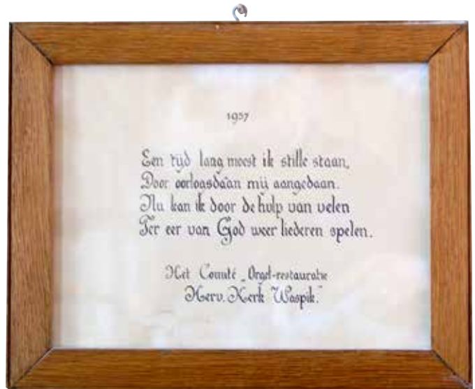
Gedenkbordje van de restauratie-1957.

Voorts werden de manualen en de manuaalkoppeling vernieuwd. De Sexquialter van het hoofdwerk werd opgeofferd om een registertrekker te hebben voor deze koppeling. Vermoedelijk was er oorspronkelijk een schuifkoppeling, het kan echter niet worden uitgesloten dat er tot 1920 in het geheel geen manuaalkoppeling aanwezig was. Ten slotte werd ook de intonatie gewijzigd, onder meer door het toevoegen van kernsteken. De oorlogsschade aan het orgel, waardoor het onbespeelbaar was geworden, werd in 1952 hersteld door de fa. G. van Leeuwen & Zonen. Dit betrof met name het vernieuwen van enkele te zeer beschadigde frontpijpen in het onderpositief en een algehele vernieuwing van de windvoorziening (motor, zakbalg en schokbalgjes).