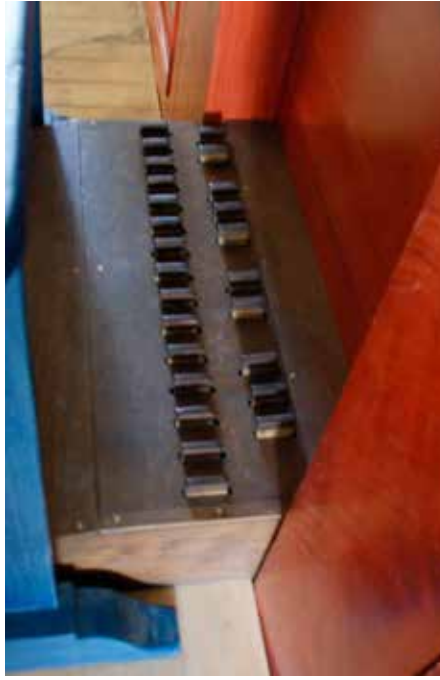
...en het kistpedaal.

prima fundament voor het plenum. Afhankelijk van de te spelen muziek kan qua plenum-registratie gevarieerd worden in het al dan niet trekken van de Sexquialter en/of de Cimbaal. Elke combinatie is overtuigend hoewel de Cimbaal en de Mixtuur in het klein octaaf en het één-gestreept octaaf soms wat gaan 'gillen'. Wanneer de Trompet 8 vt bij het plenum wordt getrokken, wordt vooral nog meer kleur toegevoegd aan het