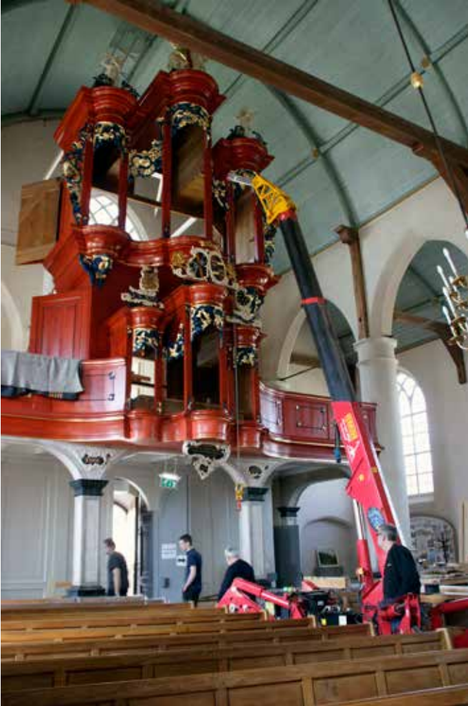
Met een mini-hijskraan worden de zware delen opgetakeld.