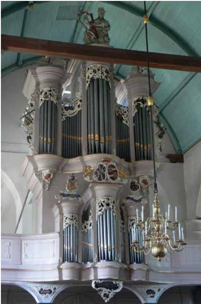
Het orgel voor 2014.