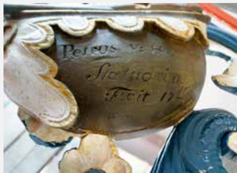
De 'handtekening' van Petrus Verhoeven op het snijwerk.