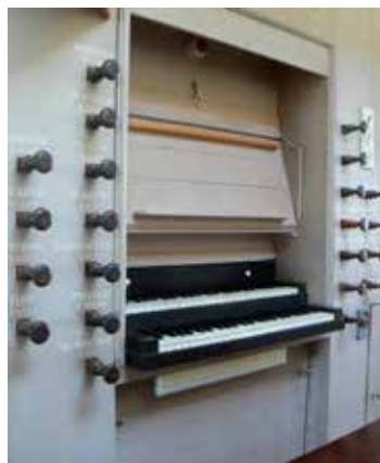
Klaviatuur voor restauratie.