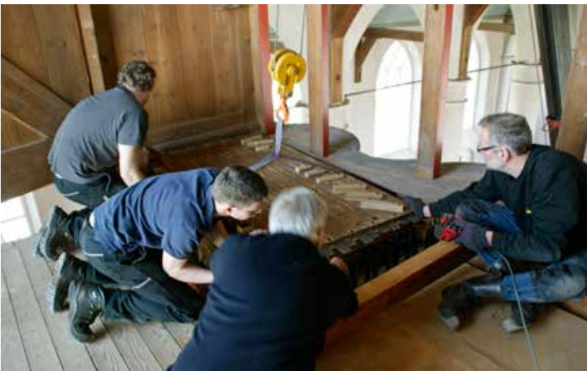
De hoofdwerkklade wordt op zijn plaats gelegd.