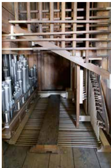
Positief-lade met mechaniek.

Zowel de register- als de speelmechaniek is grotendeels origineel. De pedaalmechaniek is vermoedelijk uit 1957/'58. Van het onderpositief is alleen het wellenbord origineel. Bij de restauratie in 1957/'58 zijn ook de