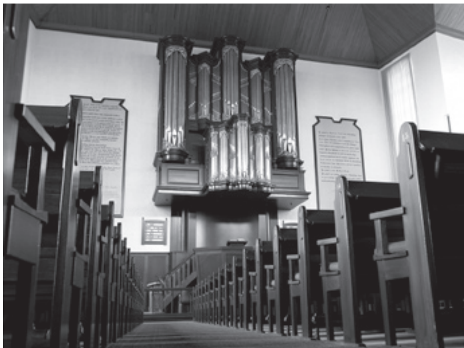
Het Van Eeken-orgel in de Noorderkerk.

Kwam er op dat moment voor jou een enorme hoeveelheid “liederen uit de schat der eeuwen” bij, of was je daar toch al buiten de eredienst mee bezig? “Het grootste verschil was de overgang van psalmen “op hele noten” naar ritmische gemeentezang, want Hervormd Rijssen zingt in principe nog gewoon de psalmen in de berijming van 1773 en de “Enige gezangen”. Op feestdagen worden er vóór de dienst wel toepasselijke gezangen gezongen. En sinds april loopt er in twee kerken een proef waarbij het