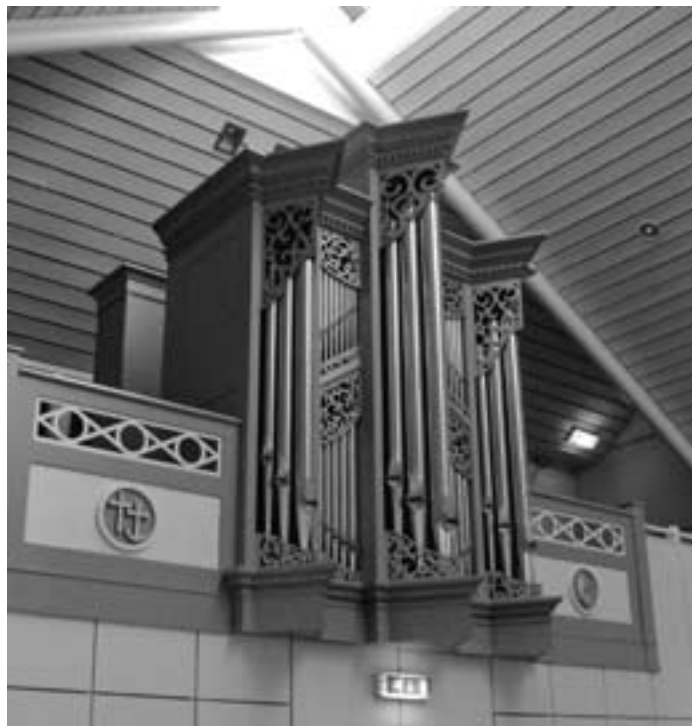
Zuidwolde, orgel Het Anker.

Pedaal: Bourdon 16 vt, Gedekt 8 vt. Tijdens het bezoek van de orgelcommissie stond het orgel voor de helft opgesteld. Het was duidelijk dat er, bij plaatsing in Zuidwolde, nogal wat