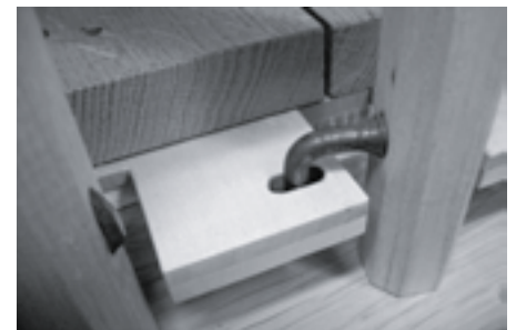
Sleep en wel.