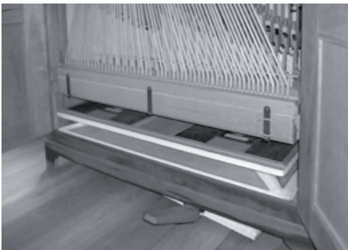
Balg en stekermecaniek.

In het boekje bij de cd die van dit orgel is gemaakt, schrijft Rini het volgende: