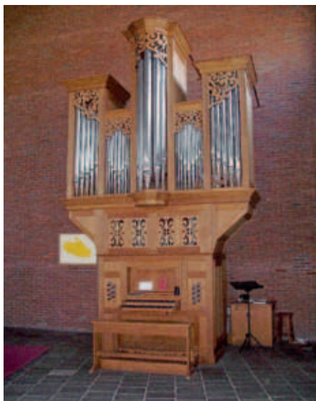
Oosterwolde, Het Anker.

Hij bood een orgel van de firma A.S.J. Dekker (bouwjaar onbekend) te koop aan van 13 stemmen, verdeeld over 2 klavieren en vrij pedaal. Hoewel de volledige dispositie niet bewaard is gebleven, worden in de archiefstukken wel registers als Vox Celeste, Trompet 8 vt en Cornet genoemd. Men werd het eens over de koop en het orgel werd geplaatst in de nieuwe Gereformeerde kerk 'Het Anker'. Al snel deden zich problemen rond het instrument voor. Het lukte de fa. Faber niet om die afdoende te herstellen, en na vier jaar besloot men advies