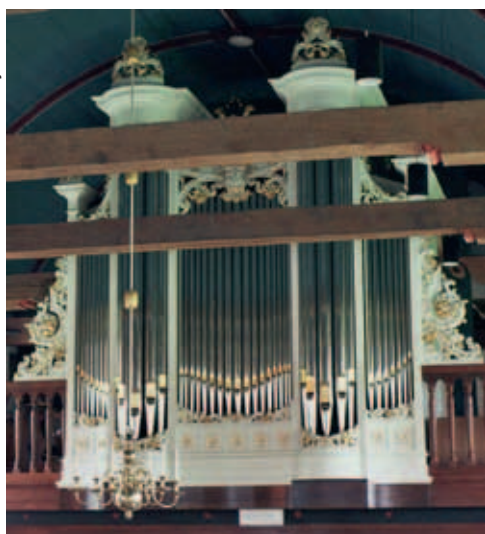
Noordwolde, Van Dam-orgel (1876).

per, de oudste dochter van ds. H. Kuyper, die hier van 1797 tot 1839 predikant was. Het orgel werd gebouwd door de orgelmakers L. van Dam en Zonen te Leeuwarden voor een bedrag van 3.400 gulden. In 1940 werd het gerestaureerd door de firma Vaas en Bron. Toen in 1967 de zijvleugel van de kerk werd verwijderd, werd het orgel naar de westzijde van de kerk verplaatst, waarbij herstellingen werden uitgevoerd door E.R. Ottes. In 2007-2008 vond een grote restauratie plaats door Orgelmakerij Bakker & Timmenga. Hierbij werd de in 1967 geplaatste Sesquialter vervangen door een Cornet 3 sterk discant, overeenkomstig de oorspronkelijke bedoeling van Van Dam. Ook werden de in 1967 verwijderde vleugelstukken weer aan het front bevestigd. De ornamenten in 'neobarokke' stijl vormen een fraai detail in het front.