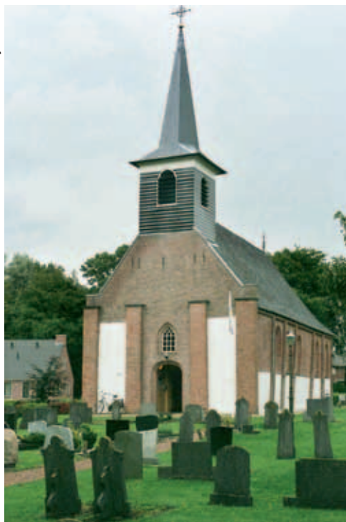
Noordwolde, Hervormde kerk.